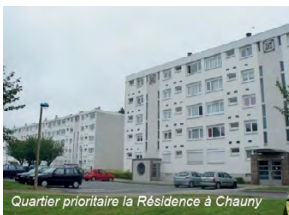
Quartier prioritaire la Résidence à Chauny

Obligatoire depuis la loi de programmation pour la ville et la cohésion urbaine du 21 Février 2014, le rapport 2017 sur la politique de la ville vient d'être adopté par le Conseil communautaire. Il détaille l'ensemble des opérations menées en faveur des quartiers prioritaires, de la Résidence à Chauny, Roosevelt-Rebequet à Tergnier et de l'Artilleur à La Fère.