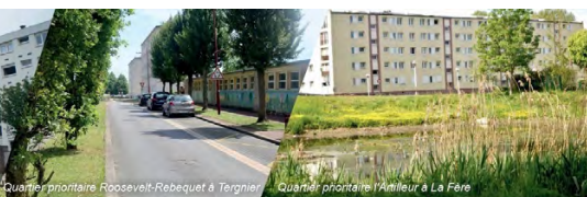
Quartier prioritaire l'Artilleur à La Fère